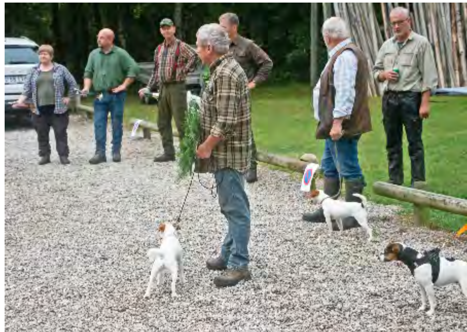
Det var anden gang Lille Østergård's Una på bare 11 måneder blev belønnet for sit sporarbejde med en førstepræmie, og hun blev derfor kåret som Dansk Sporchampion.